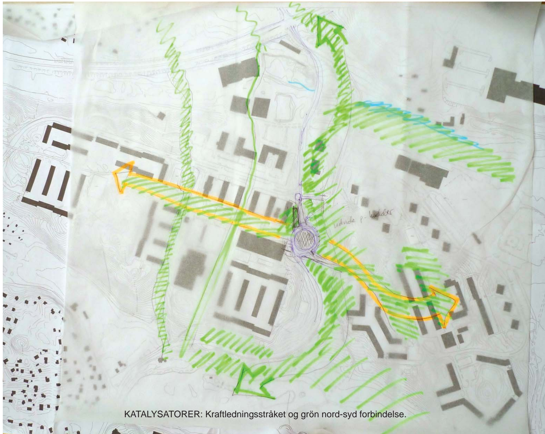
KATALYSATORER: Kraftledningsstråket og grøn nord-syd forbindelse.