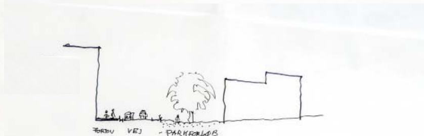
SNIT B Asymetrisk vägprofil, den gröna nord-syd forbindelse er her langs vägen.