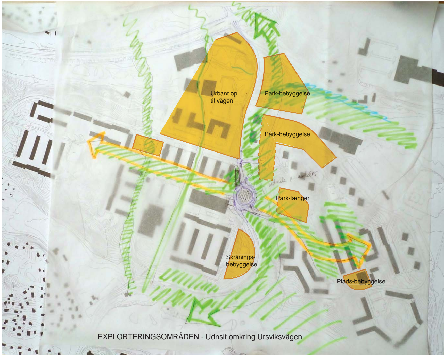
EXPLORTERINGSOMRÅDEN - Udsnit omkring Ursviksvägen